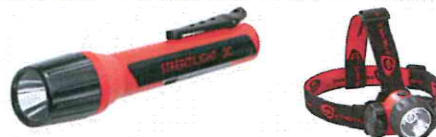
ルミテック：国内防爆対応LED照明 LEDハズロ

日本国内で唯一防爆対応のLED照明をご紹介します。ルミテックの防爆対応型LED照明は社団法人産業安全技術協会による防爆構造電気機械器具検定を取得しています。これにより、持ち込みが厳しい防爆エリアにおいて、最大300時間以上点灯が可能で長時間の作業にも安心してお使いいただけます。ボディーには耐衝撃ポリマー樹脂製を採用し絶縁性が要求される電気関係の作業にも最適となっております。